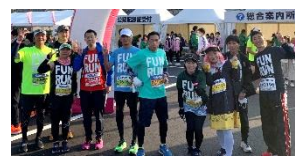
2023年桜マラソンスタート前 「完走目指して頑張るぞ～」